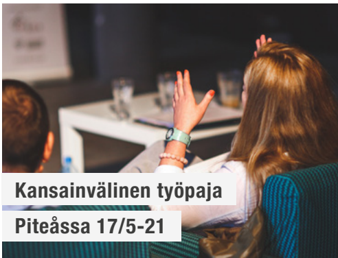
Kansainvälinen työpaja Piteåssa 17/5-21

Syksy on saapunut myös Nordic NaBS -projektiin. Pandemiaan liittyvät turvallisuussuositukset huomioiden olemme varovasti käynnistelleet hanke-toimintaa, kuten pilotointeja yrityksissä ja työpajoja pienille osallistujaryhmille, mutta ennen kaikkea jatkaneet työskentelyä digitaalisesti. Poikkeustilan-teen takia on entistä tärkeämpää hyödyntää mahdollisuus olla kauniissa luonnossa ja nauttia syksystä. Tervetuloa tutustumaan tämän vuoden toiseen uutiskirjeeseemme!